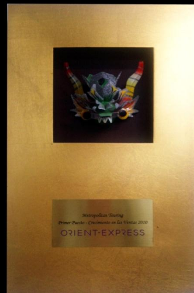
Hoteles Orient Express, Premio a las Ventas 1er puesto en crecimiento - 2010