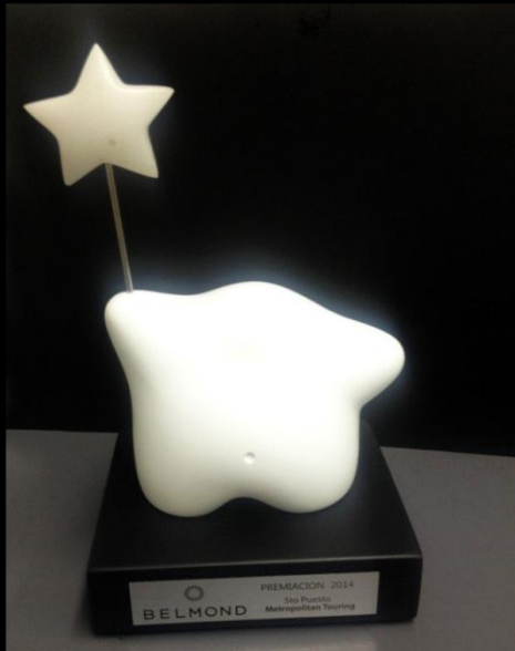
Hoteles Belmond, Premio a las Ventas 5to puesto - 2014