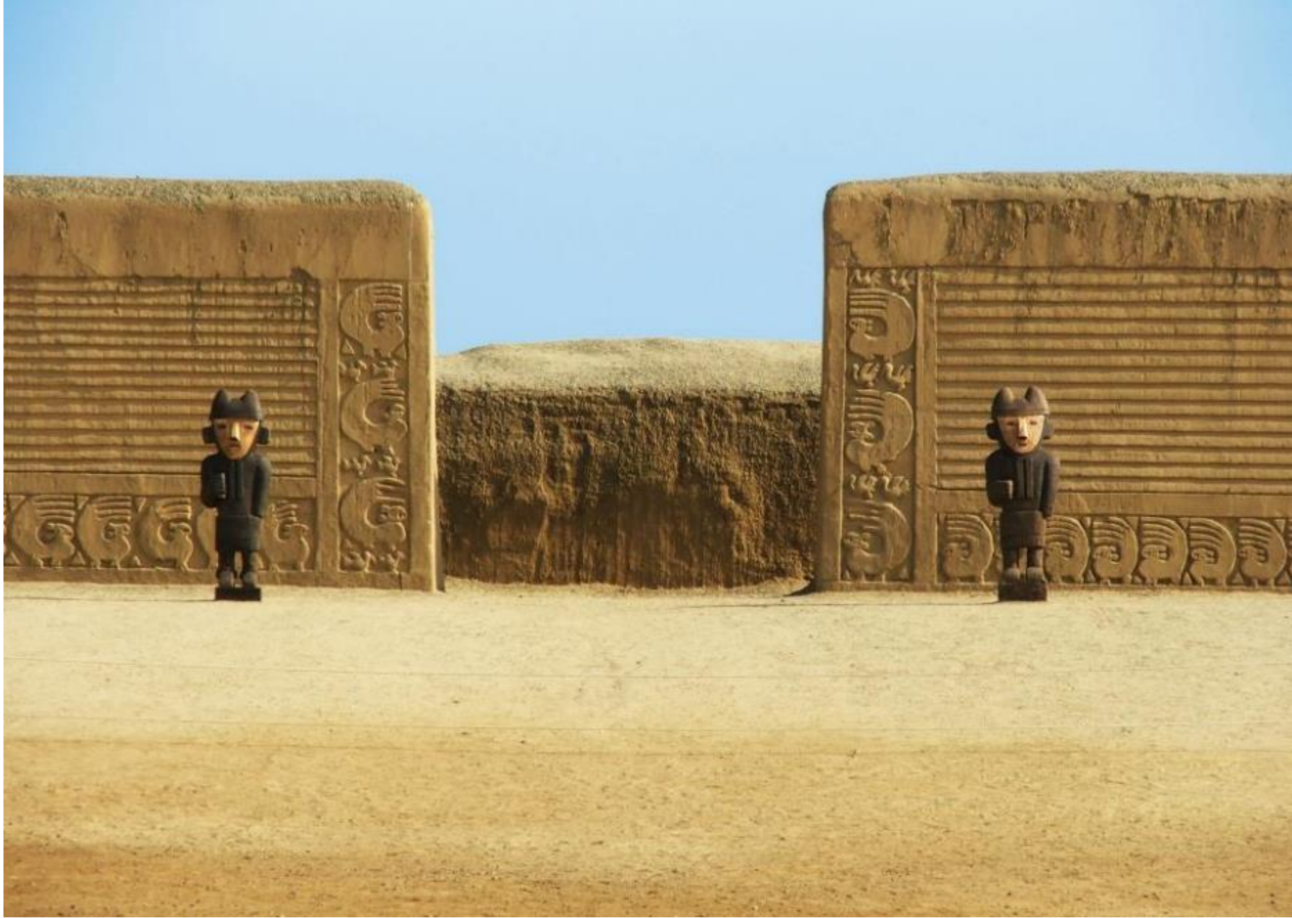
Ciudadela de Chan Chan