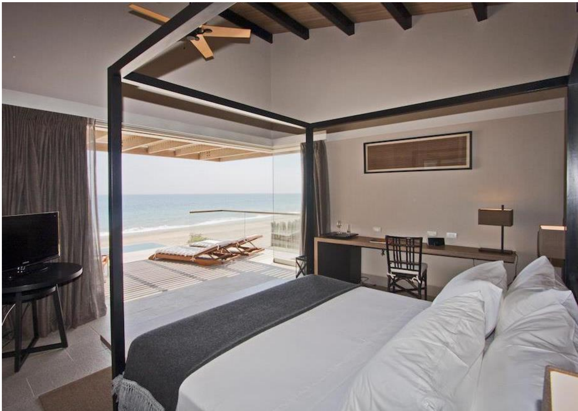
Hotel Arrenas de Máncora - Máncora