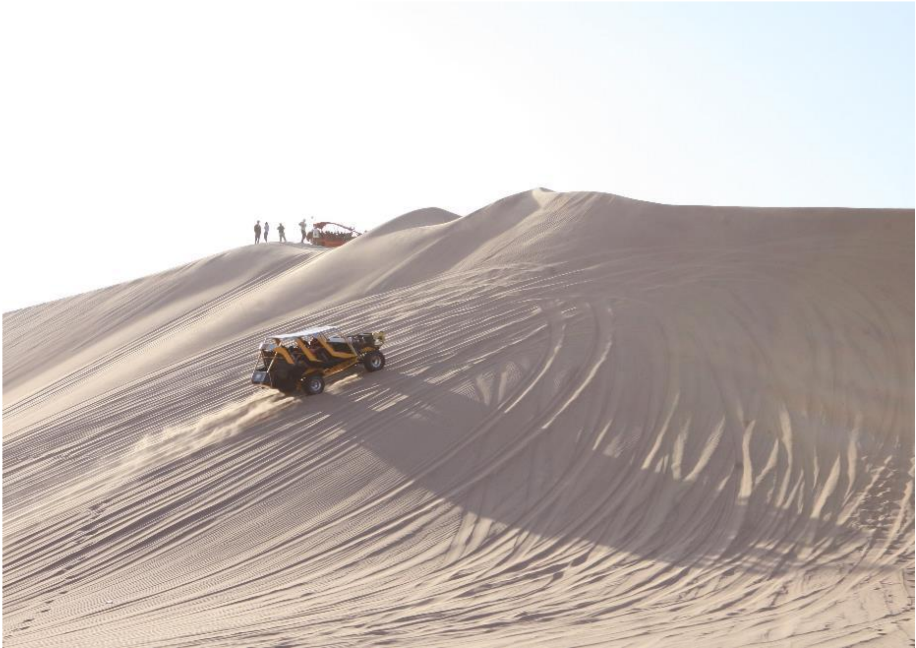
4x4 buggy en las dunas