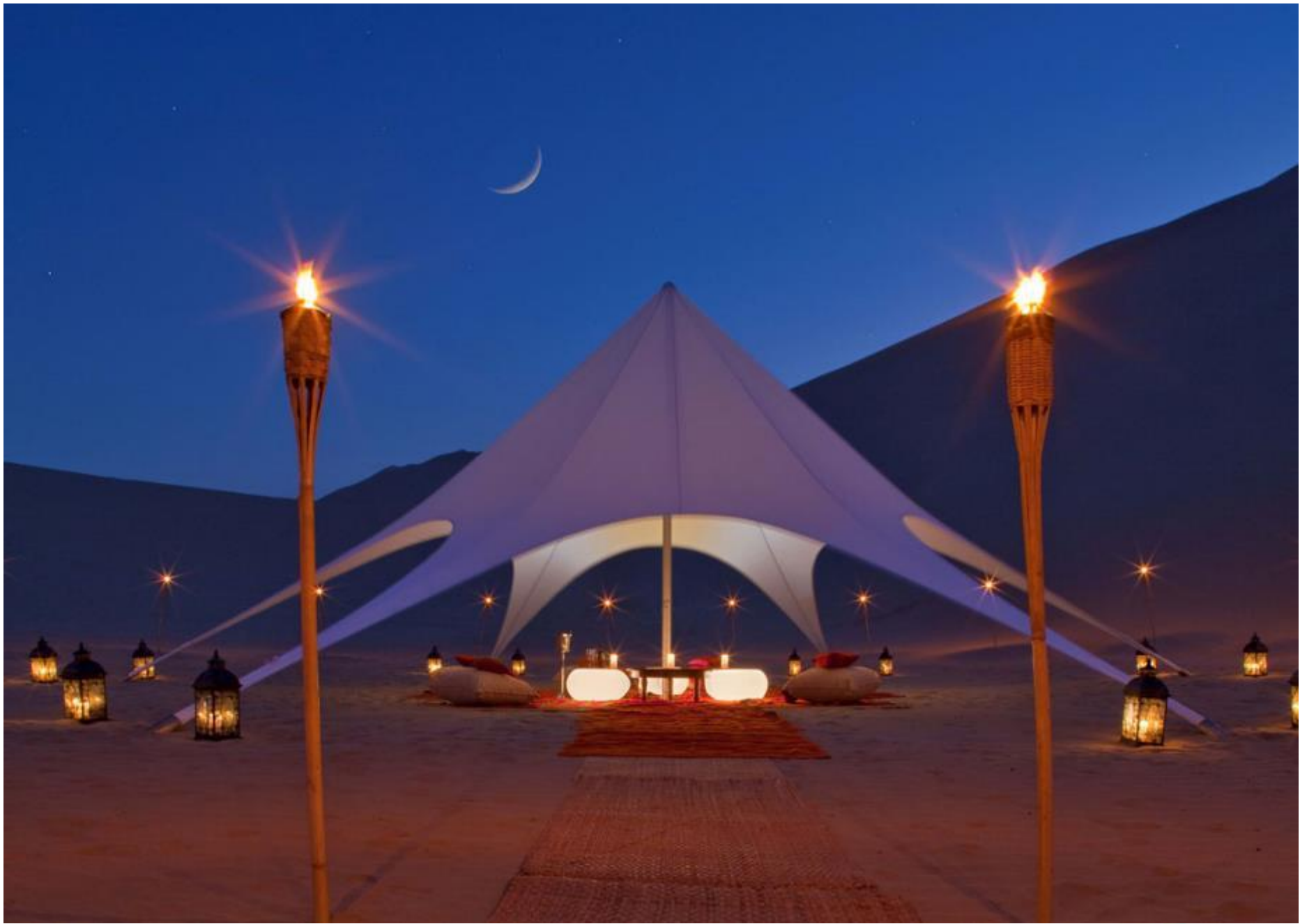
Aventura en el desierto