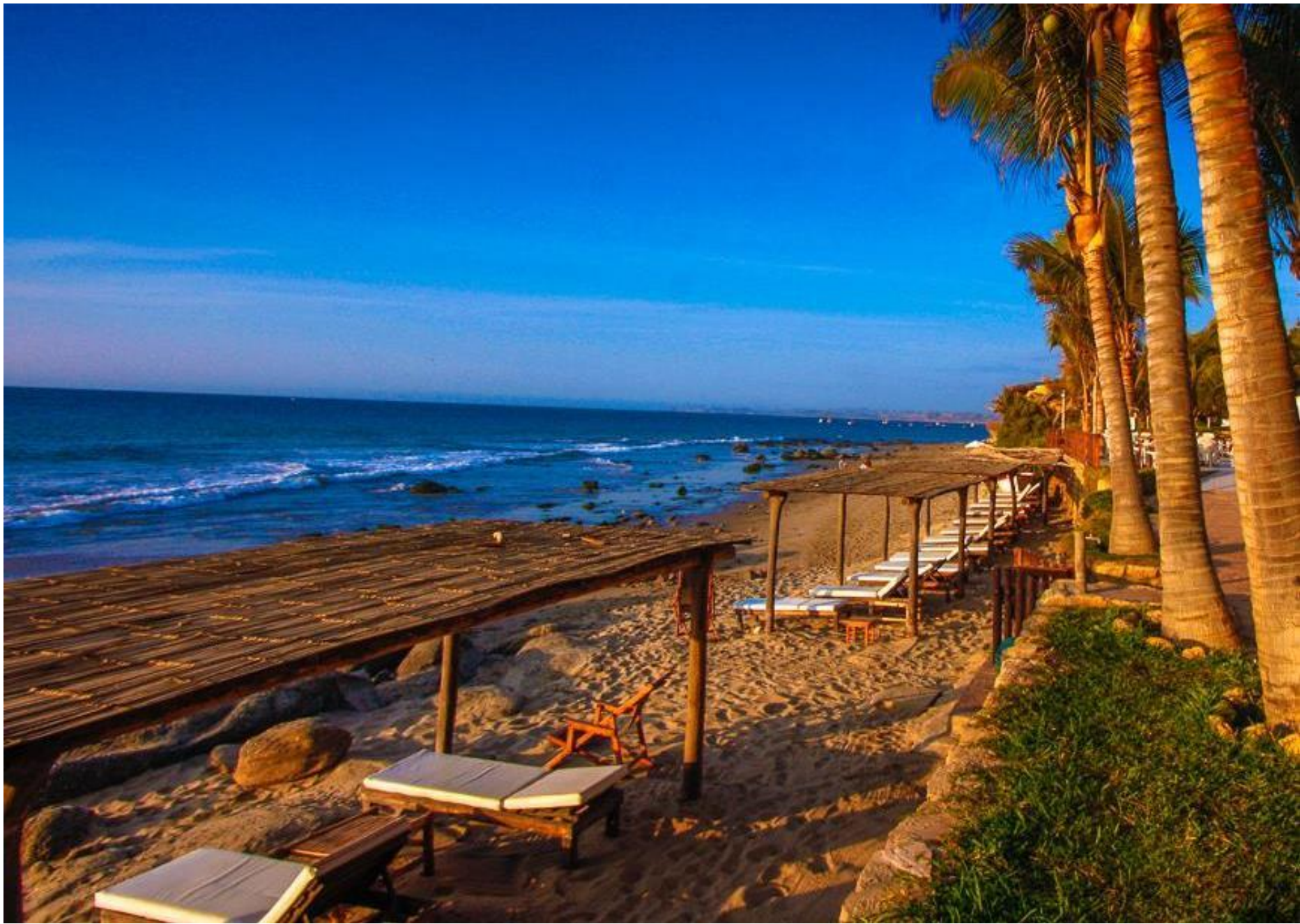
Playa de Máncora - Piura