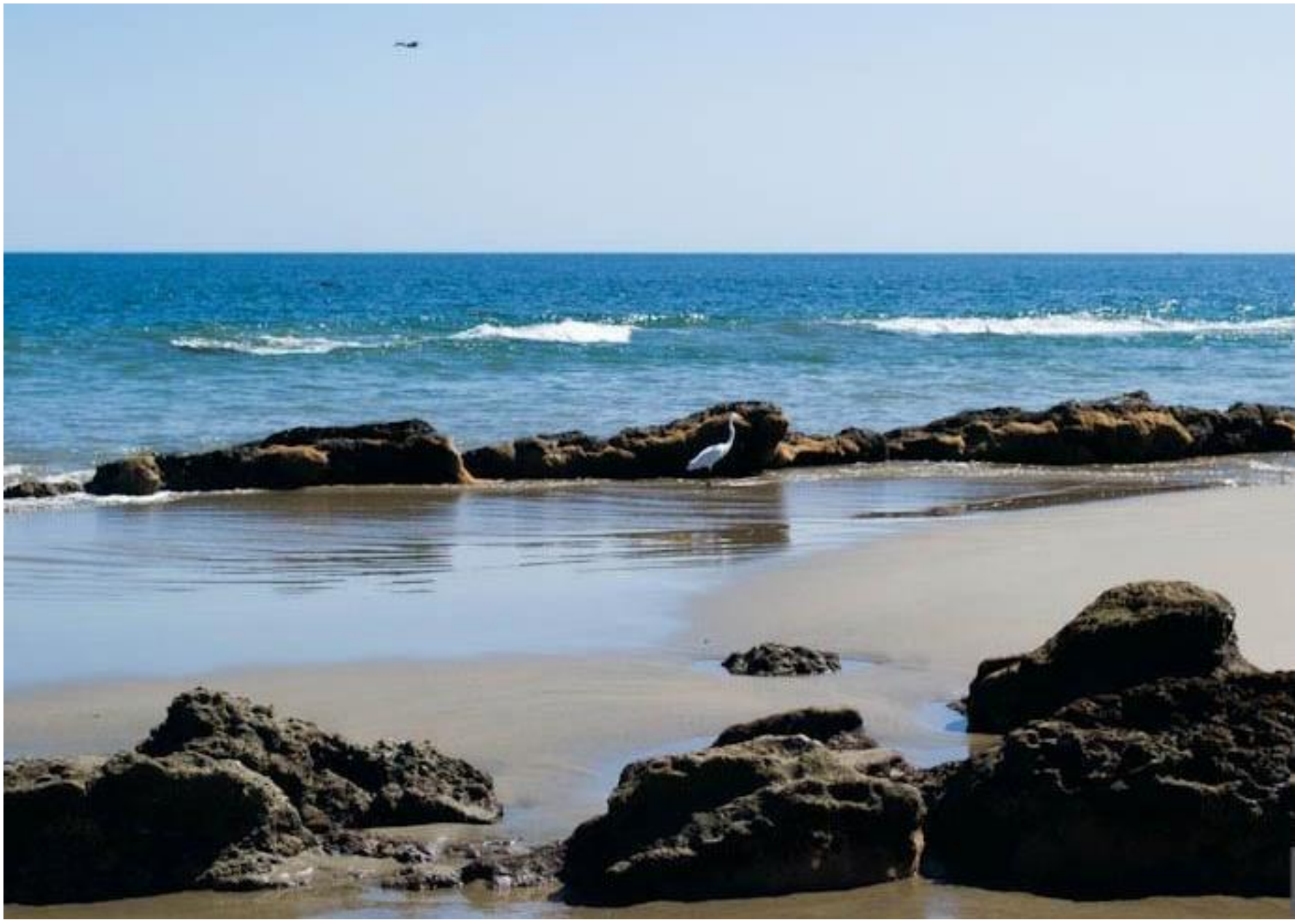
Playa Las Pocitas