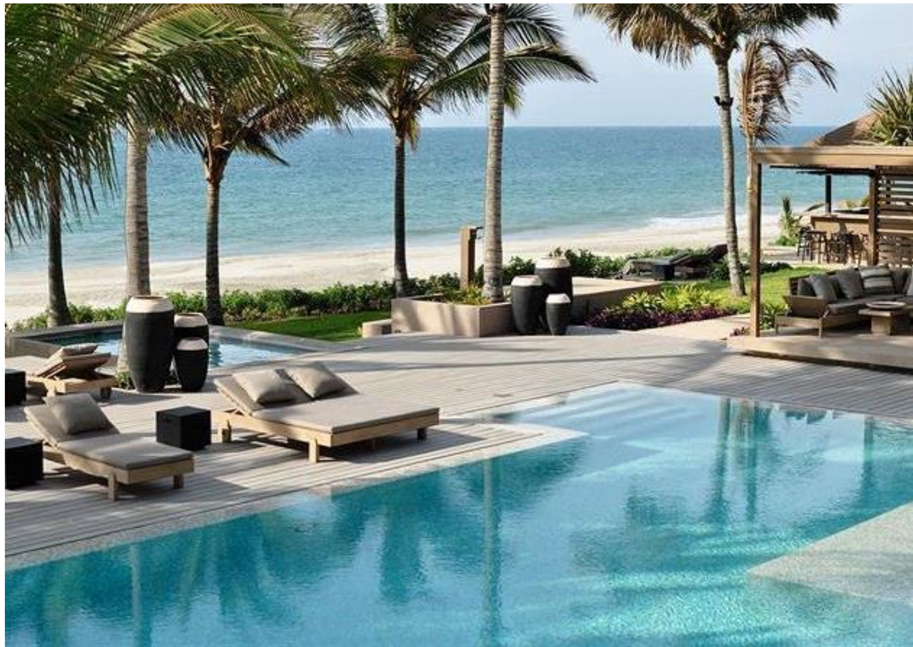
Hotel Arrenas de Máncora - Máncora