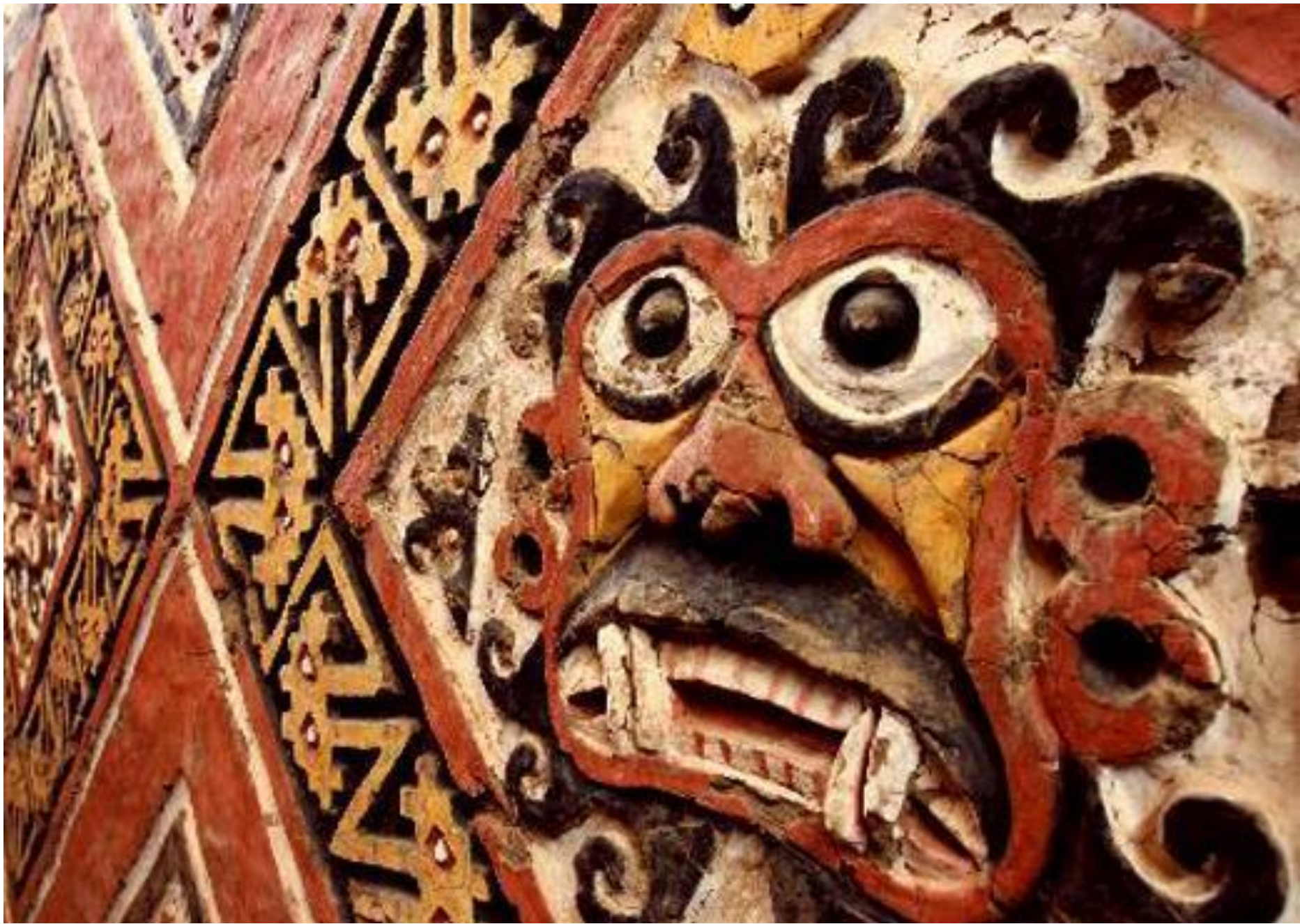
Huacas del Sol y de la Luna