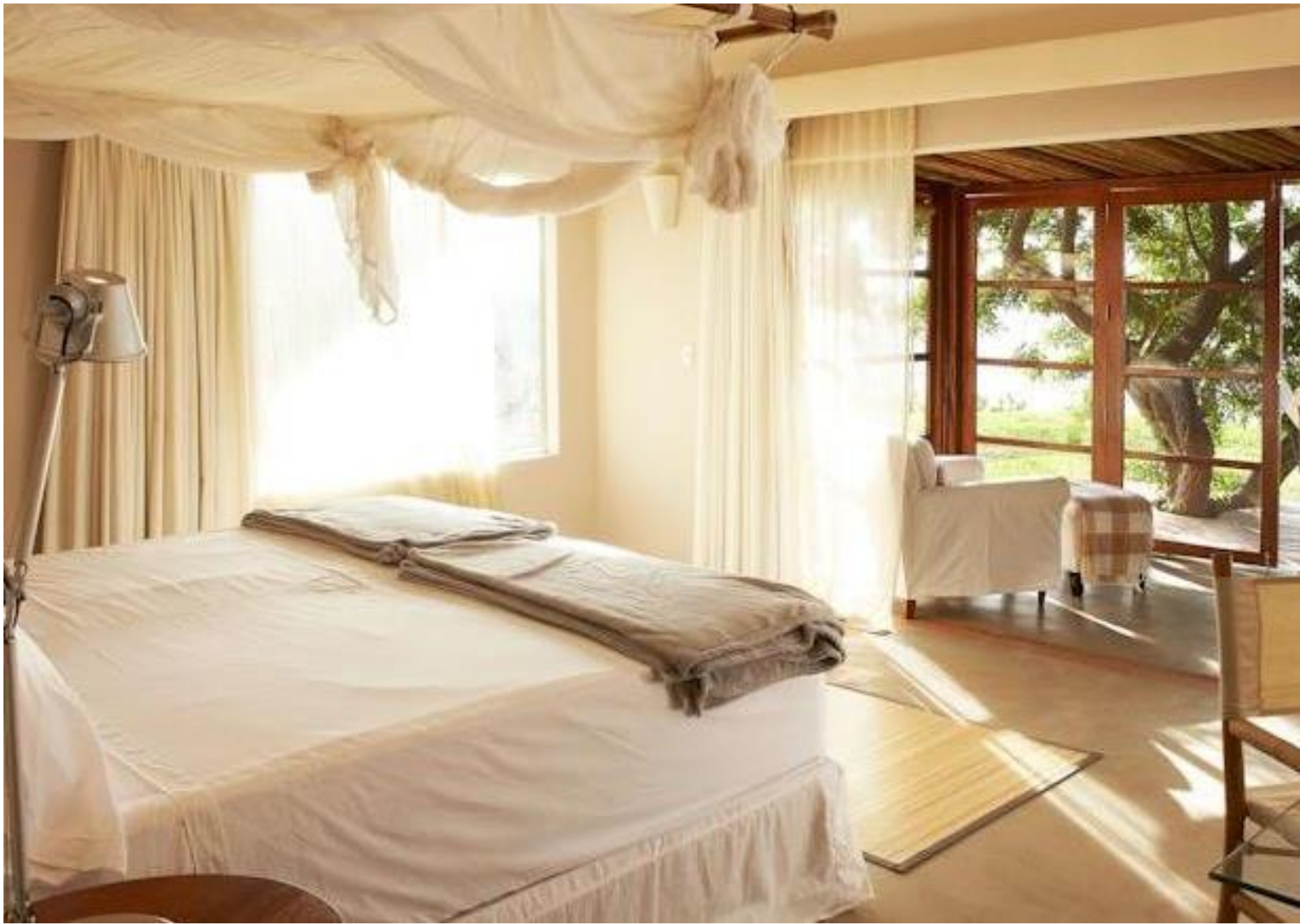
Hotel Boutique KiChic – Las Pocitas , Mancora