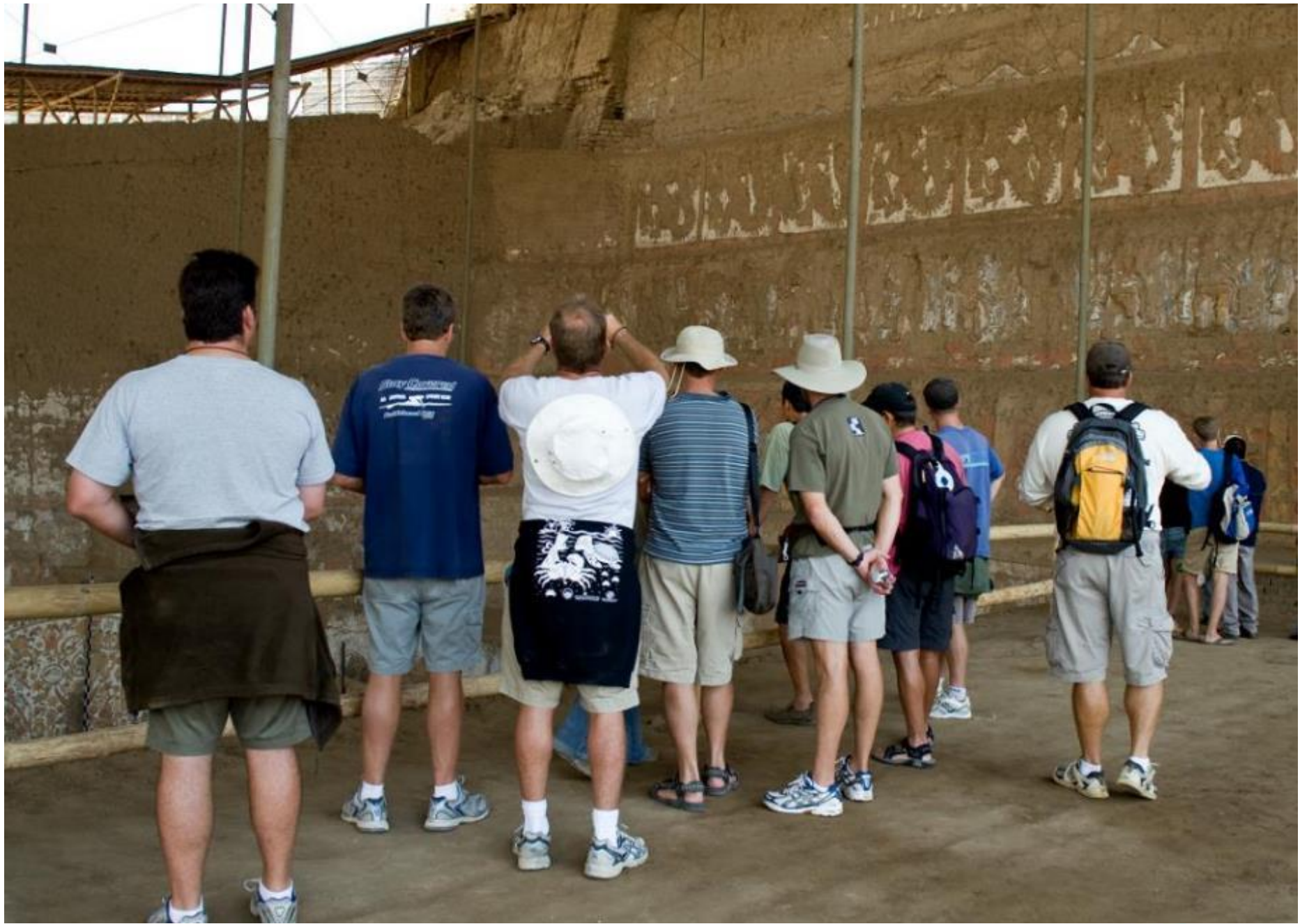
Huacas del Sol y de la Luna