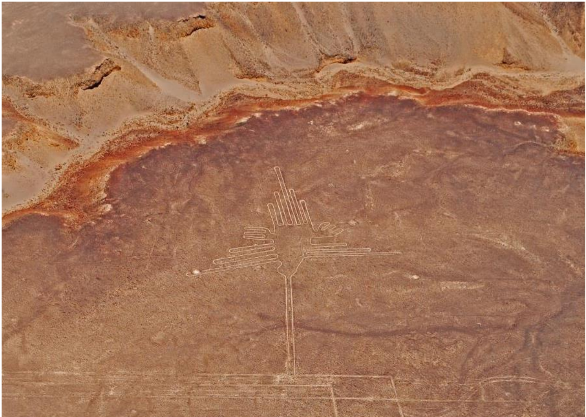
Líneas de Nazca