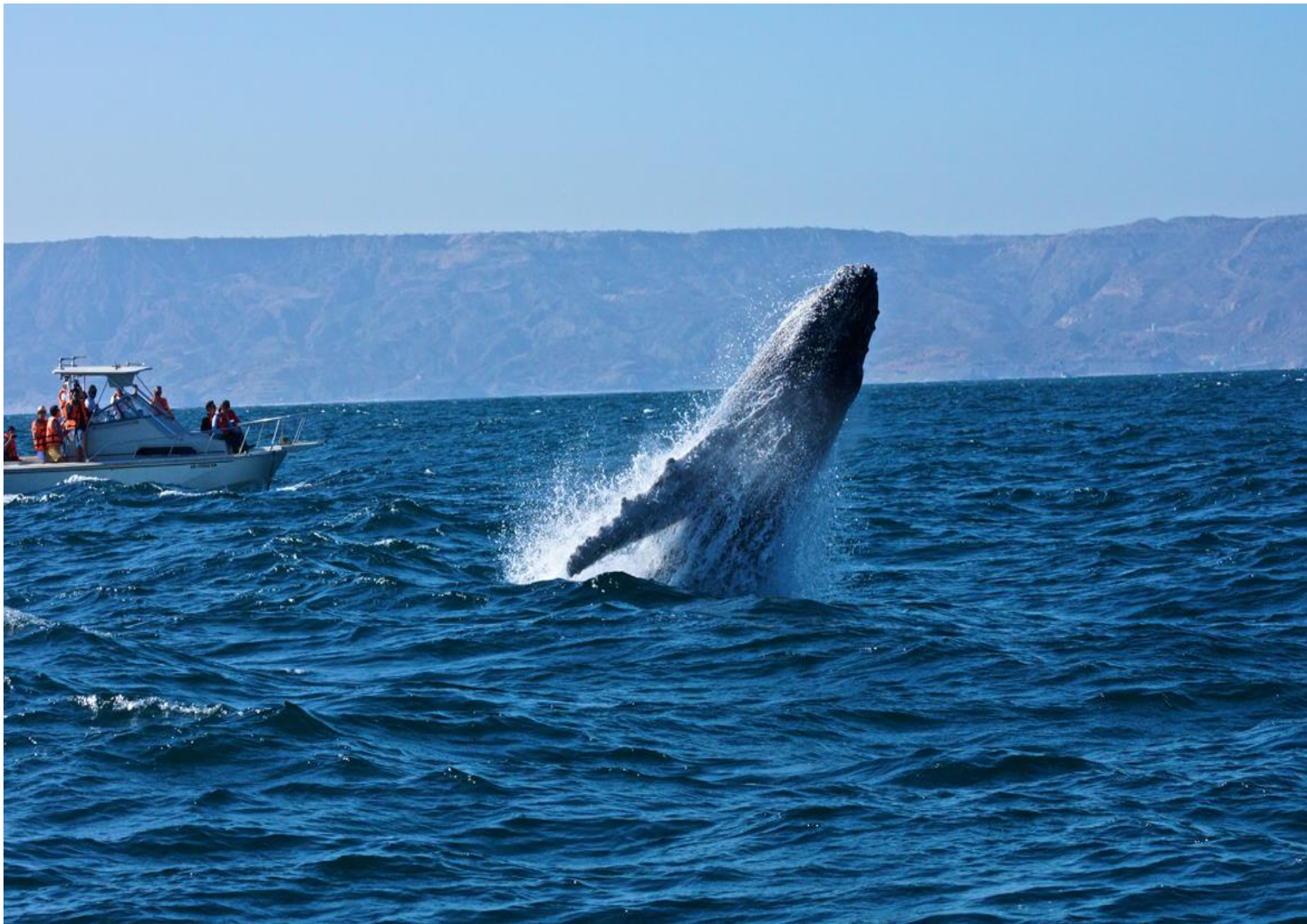
Avistamiento de ballenas