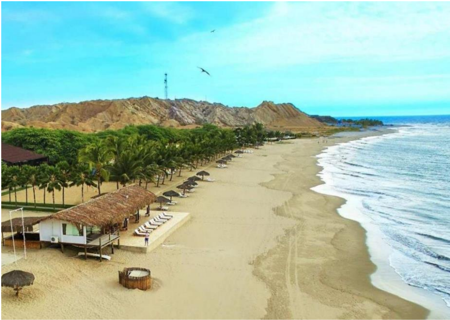
Playa Punta Sal - Tumbes