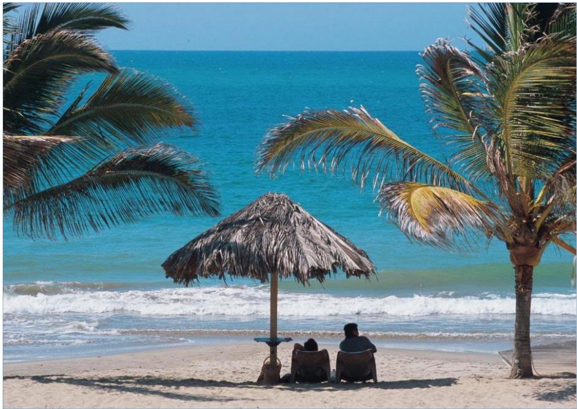
Playa de Zorritos