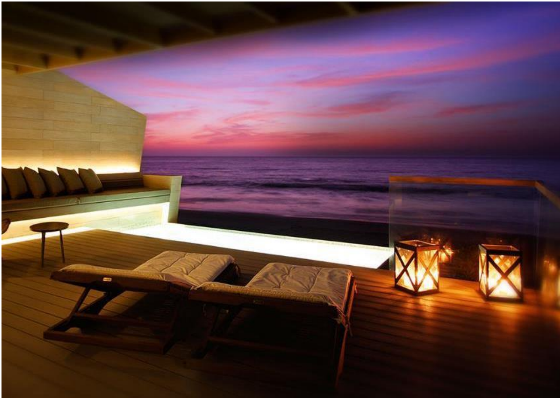
Hotel Arrenas de Máncora - Máncora