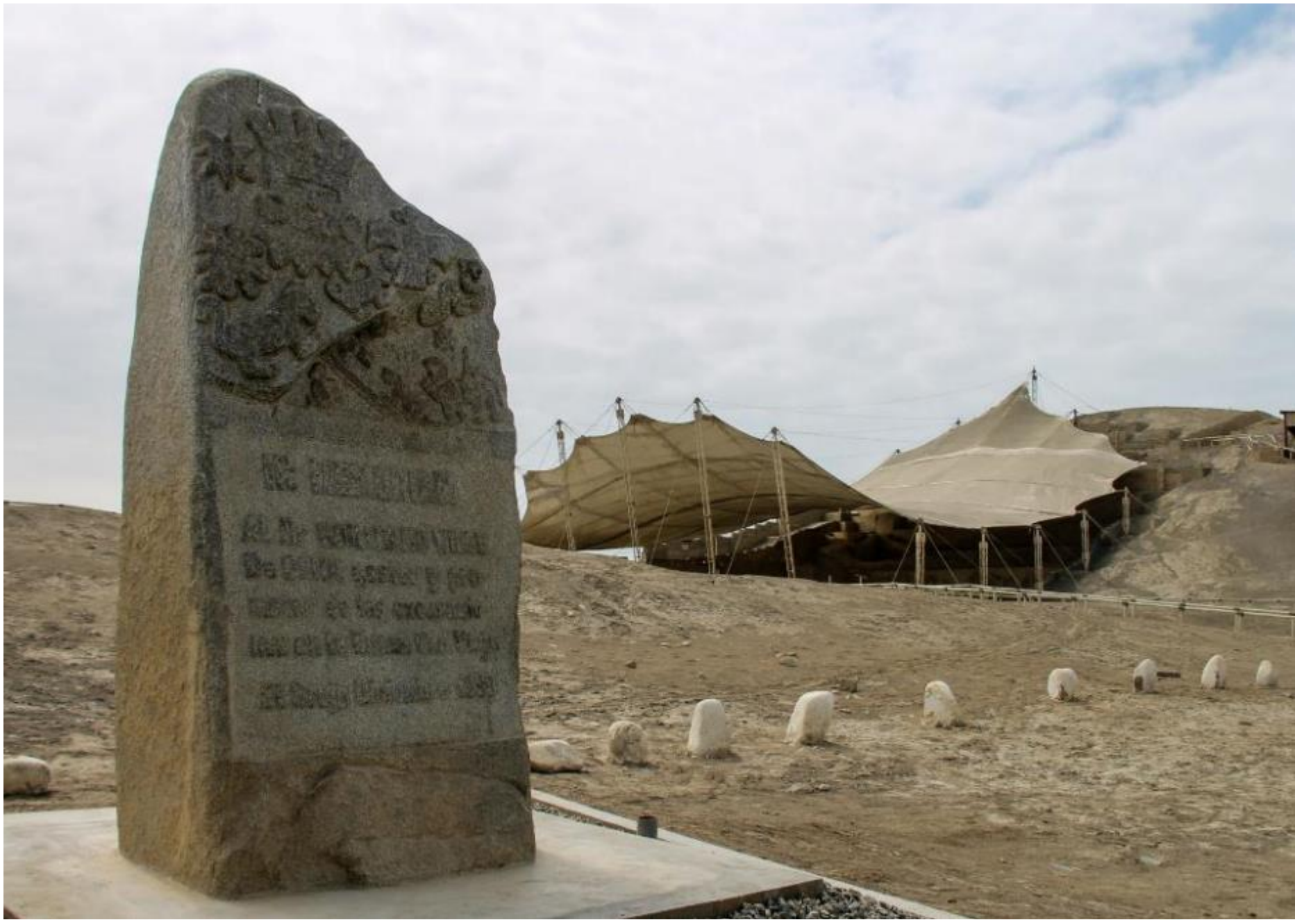
Complejo arqueológico El Brujo