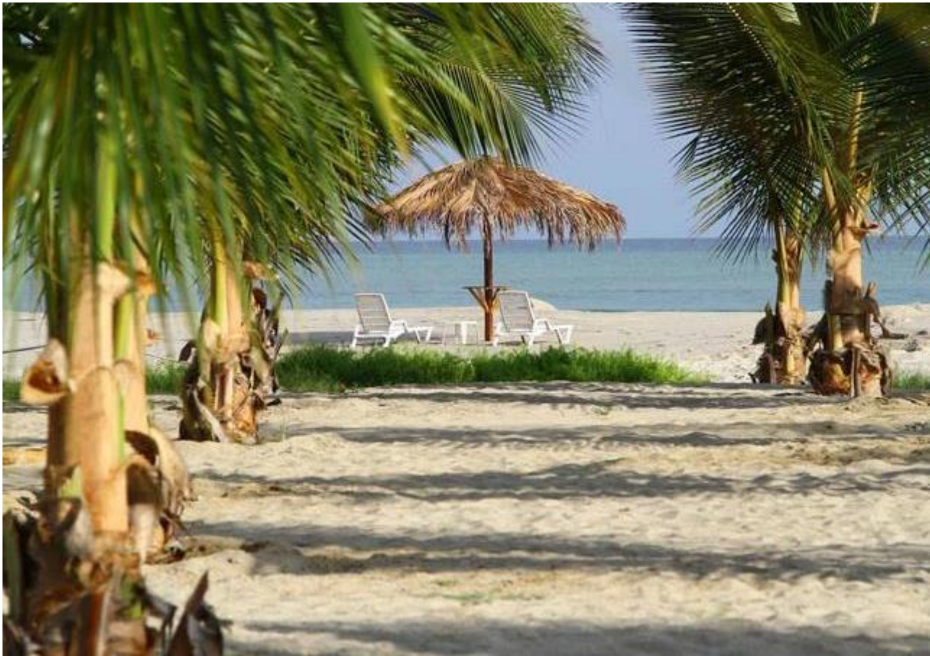
Casa Andina Select Zorritos - Tumbes