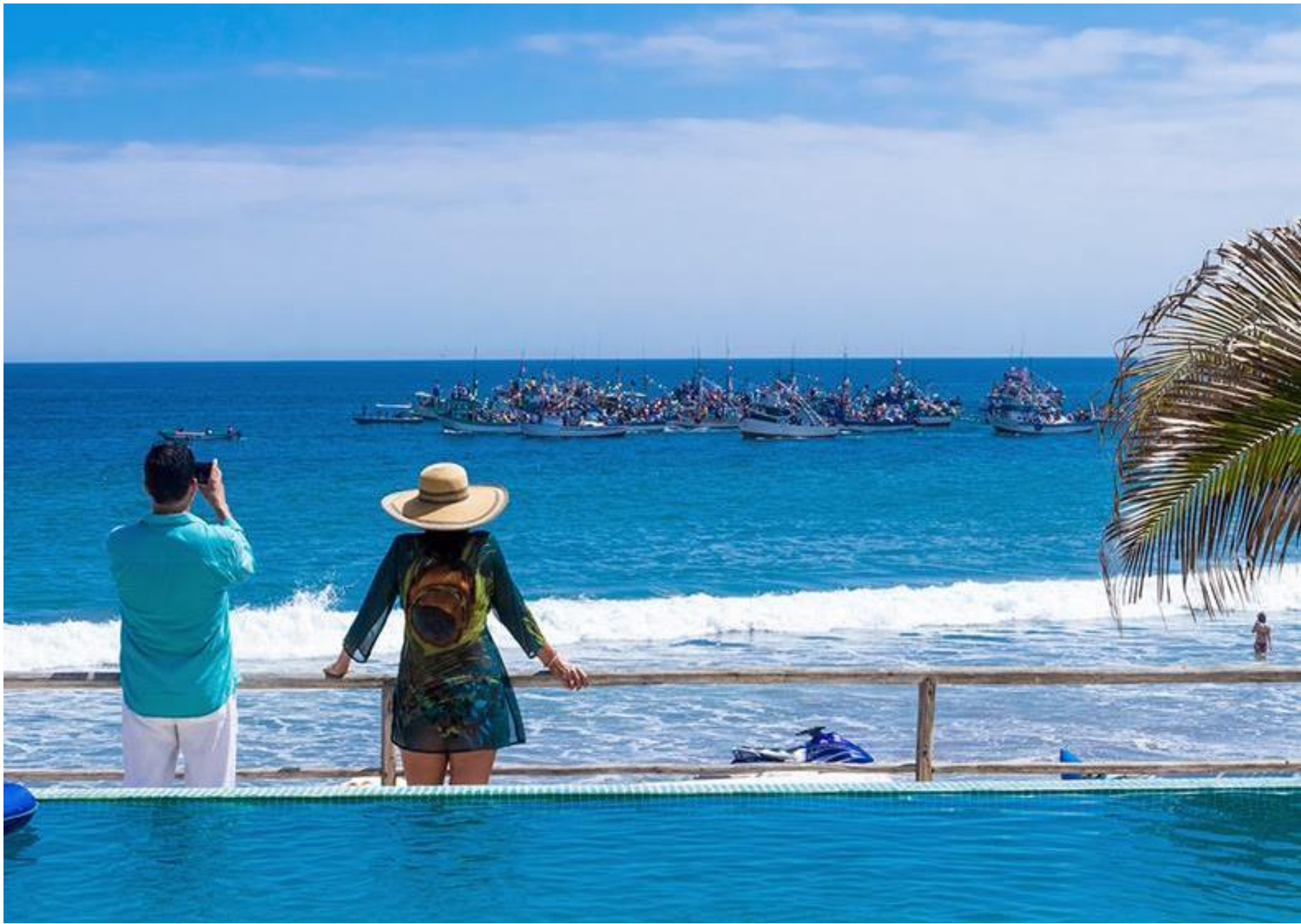
DCO Suites, Lounge y Spa – Las Pocitas, Máncora