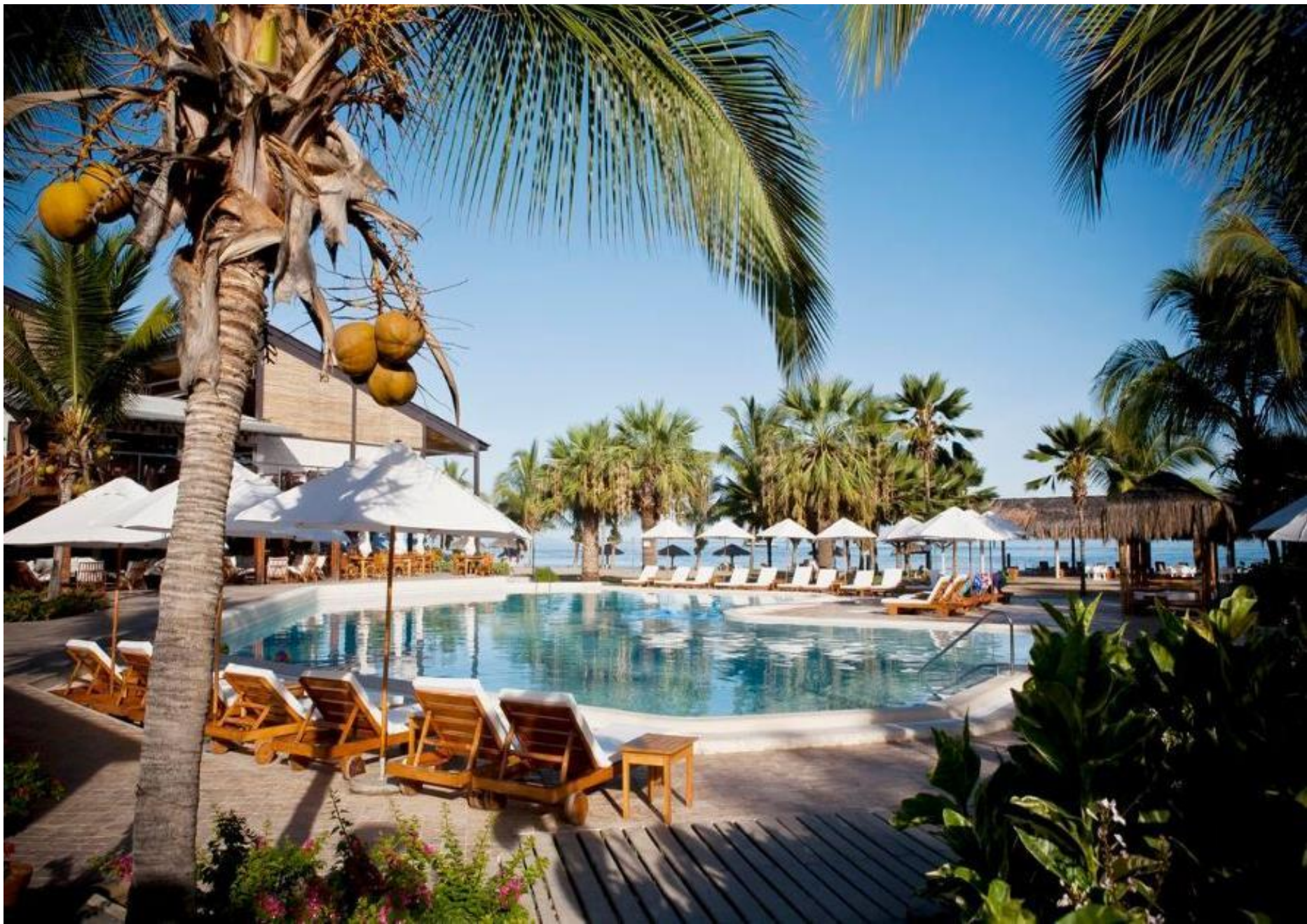
Punta Sal Suites y Bungalows