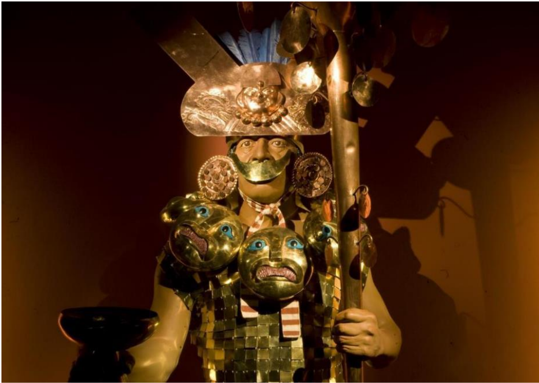
Señor de Sipán