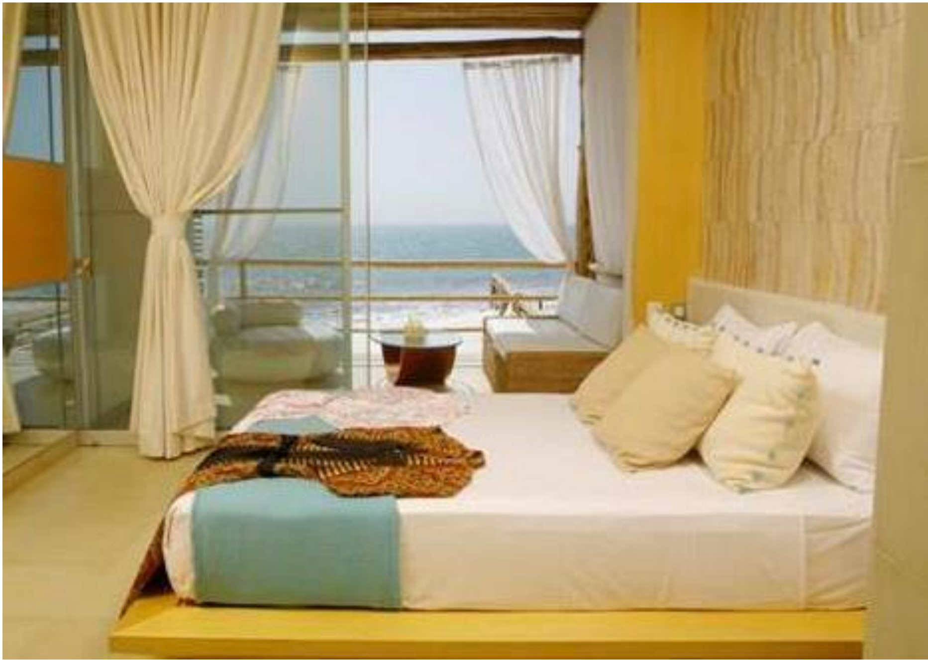
DCO Suites, Lounge y Spa – Las Pocitas, Máncora