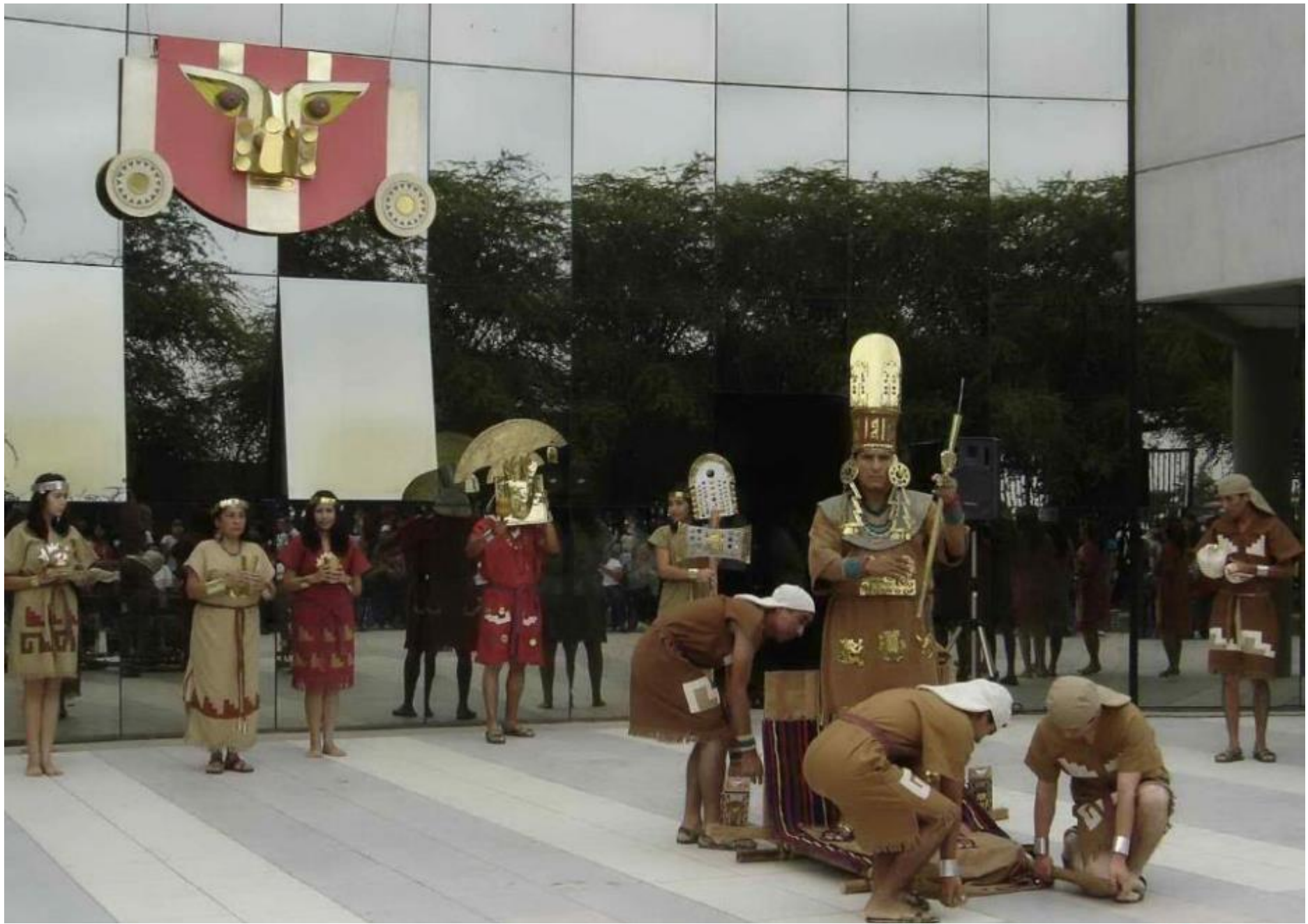
Museo Nacional Sicán