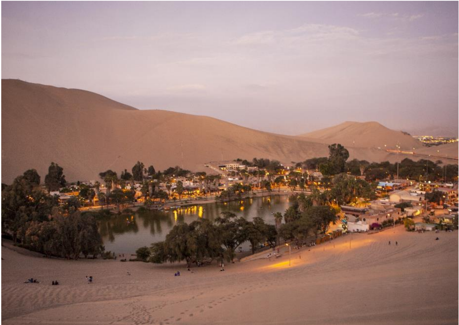
Oasis místico de la Huacachina