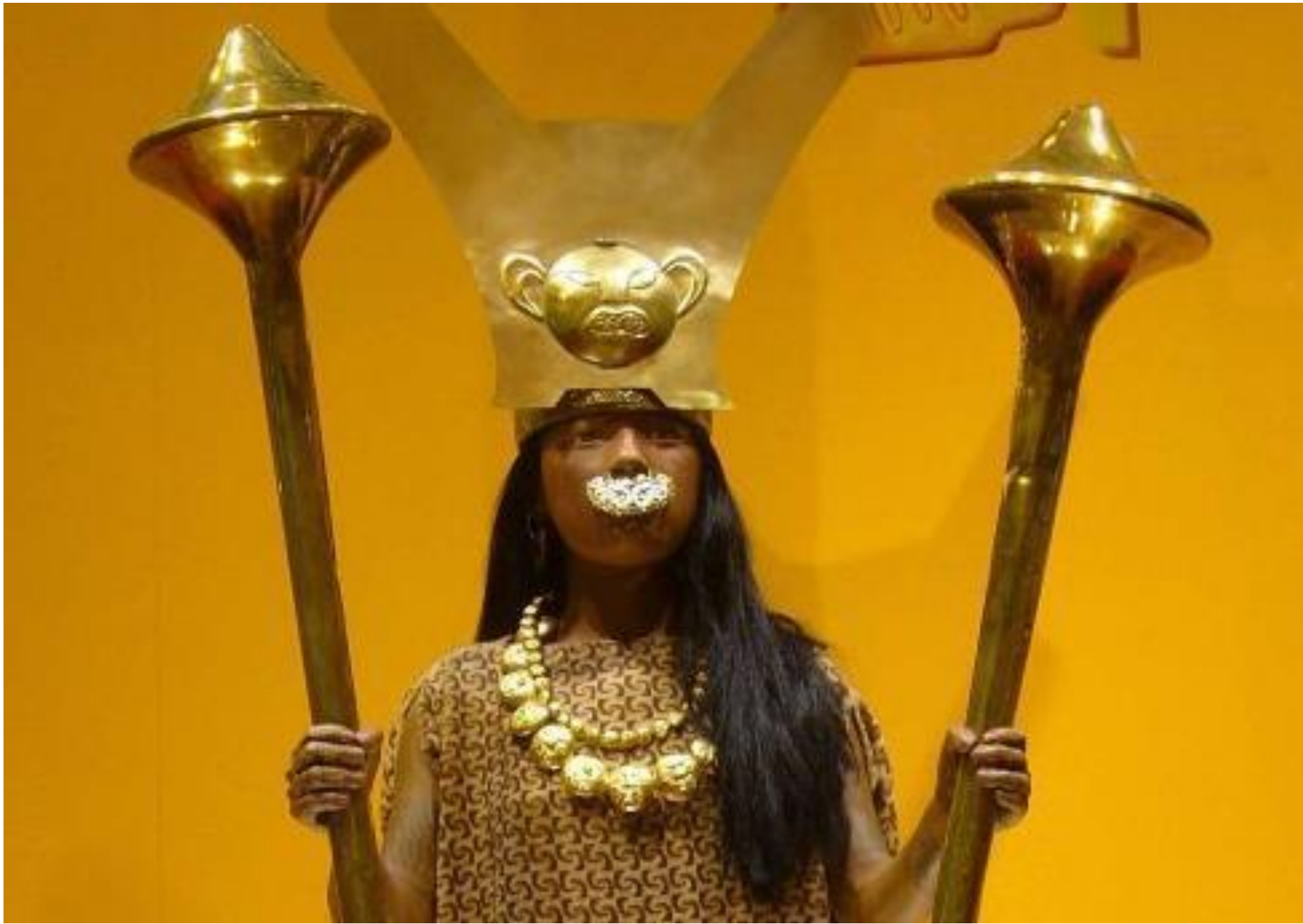
Momia de la Dama de Cao