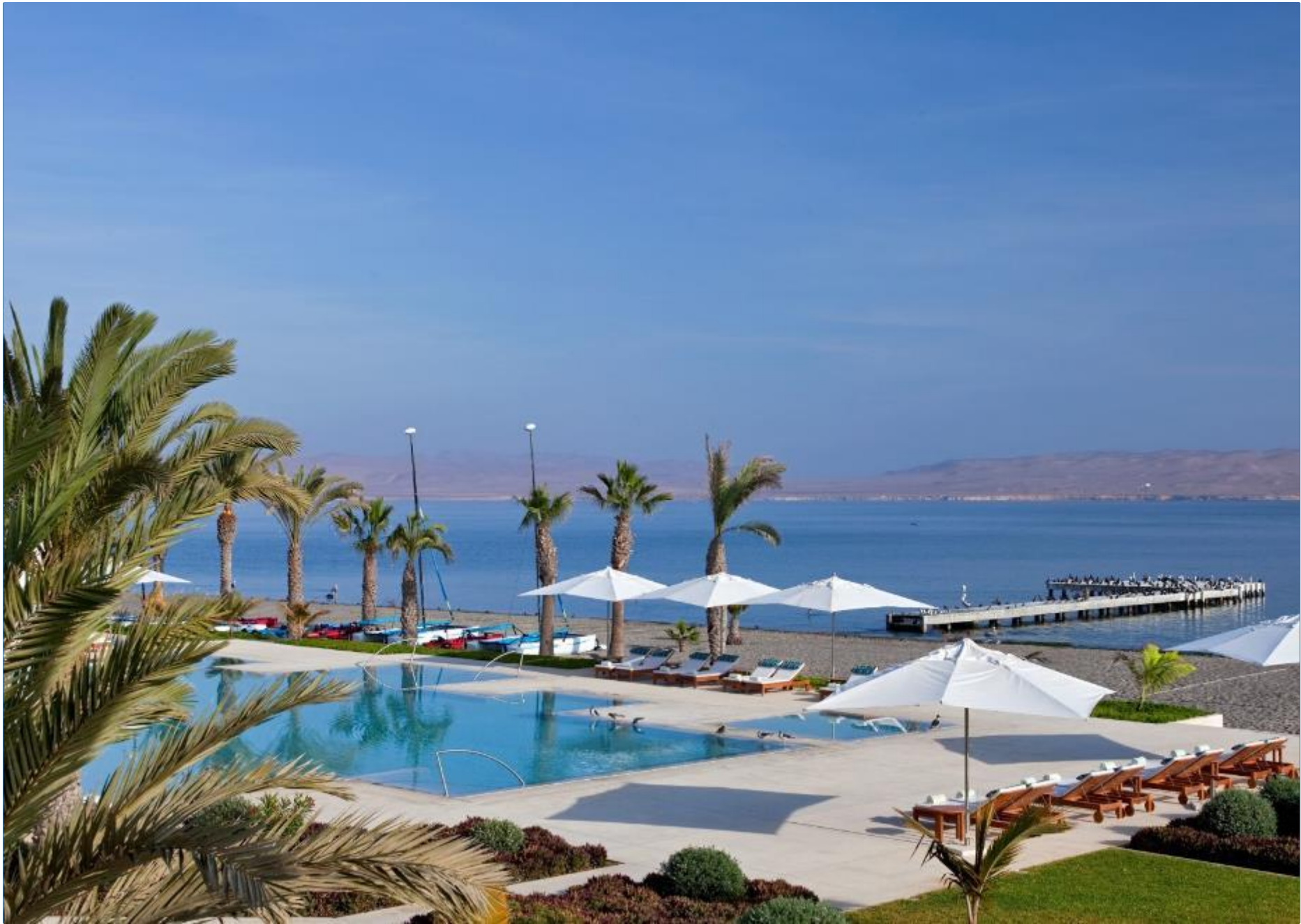
Hotel Libertador Paracas