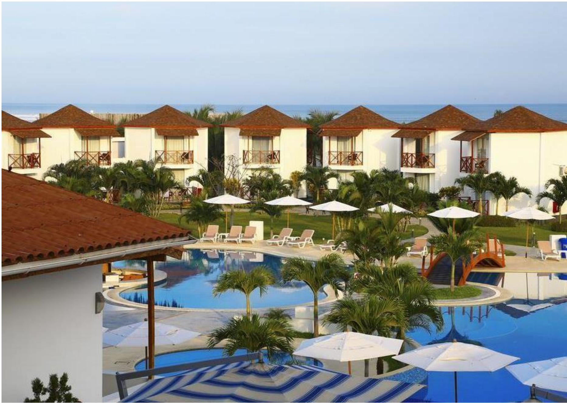
Casa Andina Select Zorritos - Tumbres