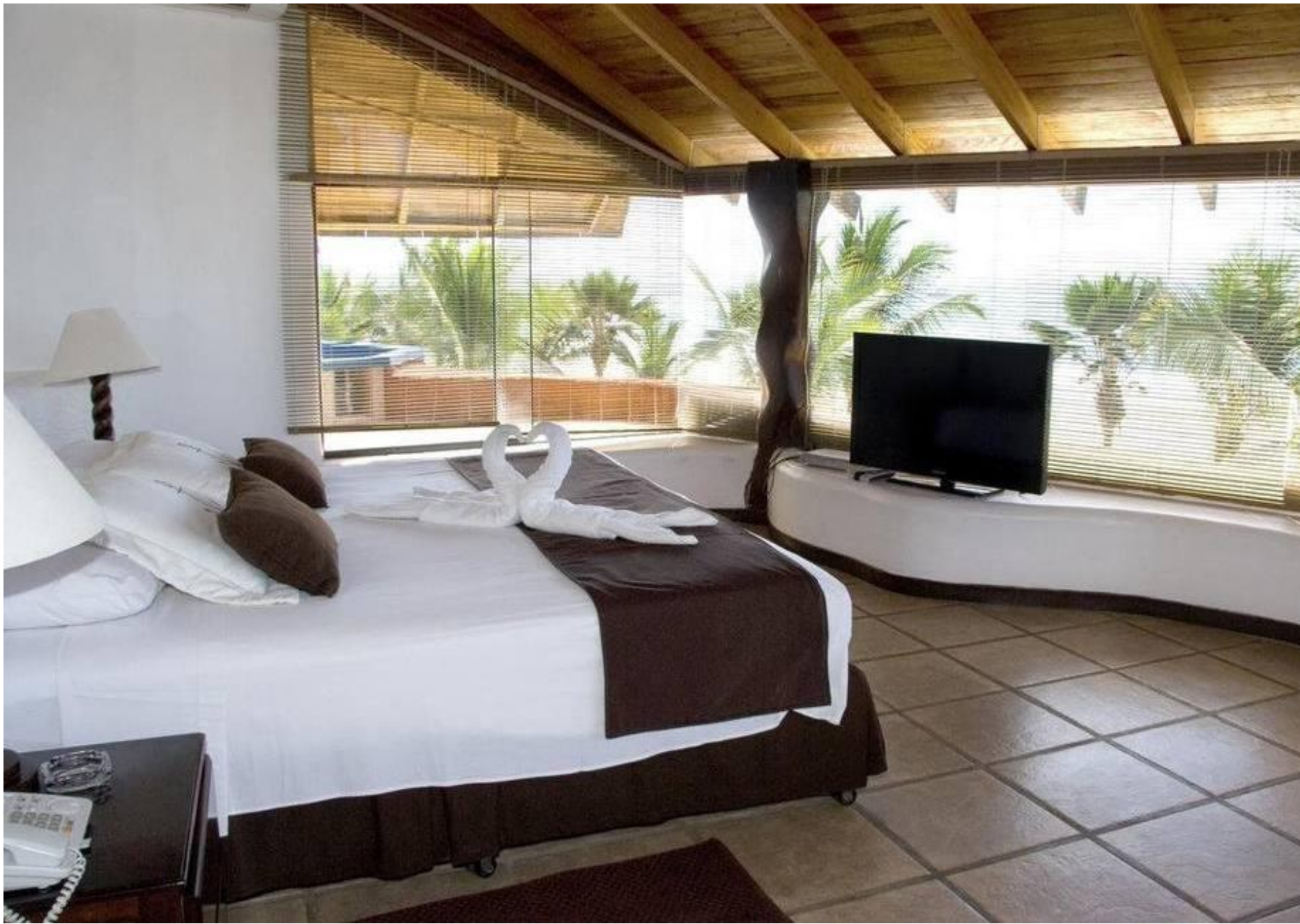
Punta Sal Suites y Bungalows