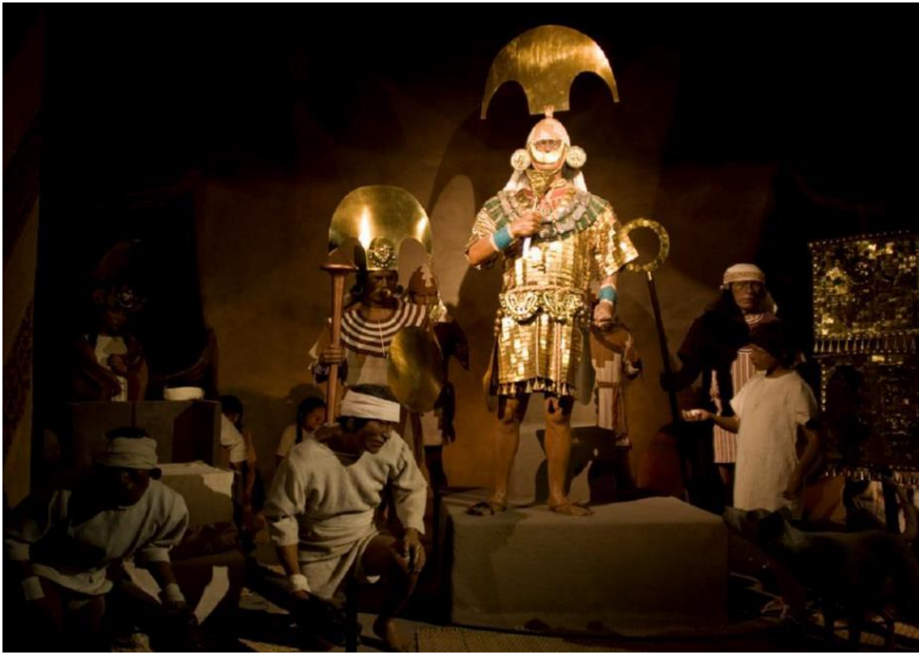
Museo Tumbas Reales de Sipán