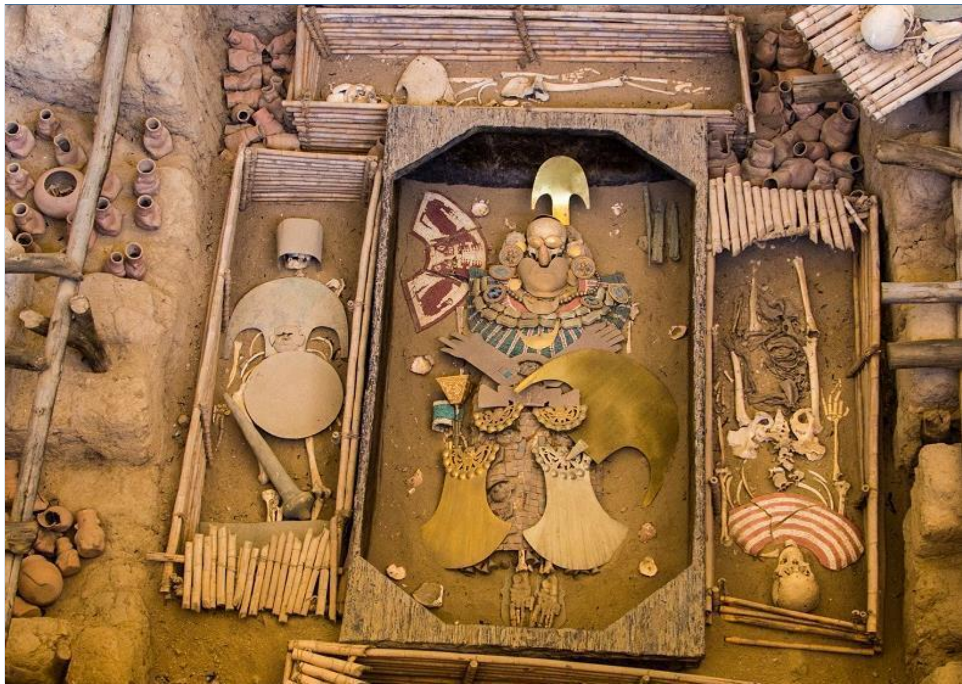
Huaca Rajada – Señor de Sipan