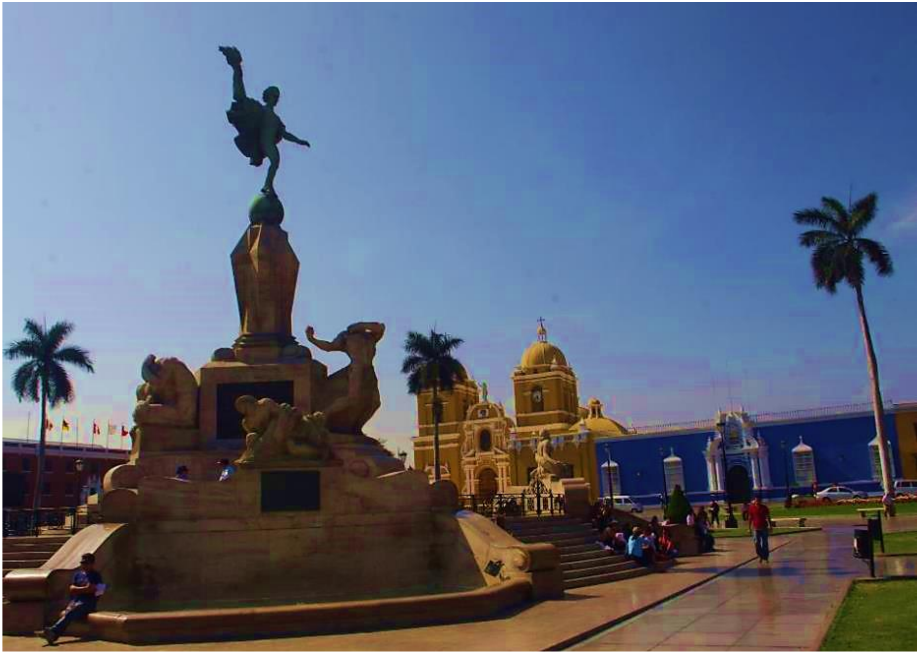
Ciudad de Trujillo