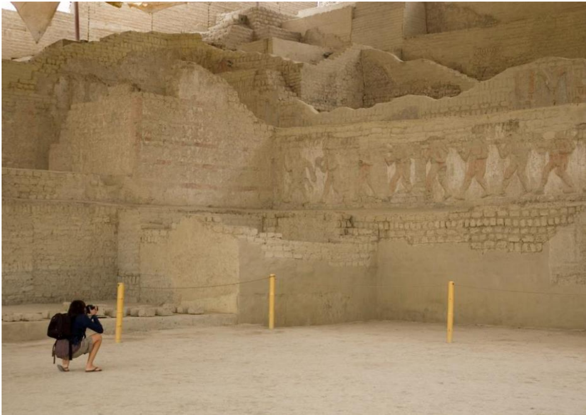
Complejo arqueológico El Brujo