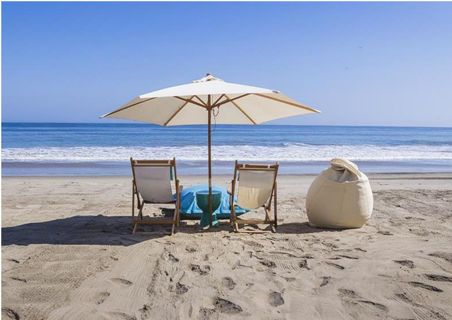
DCO Suites, Lounge y Spa – Las Pocitas, Máncora