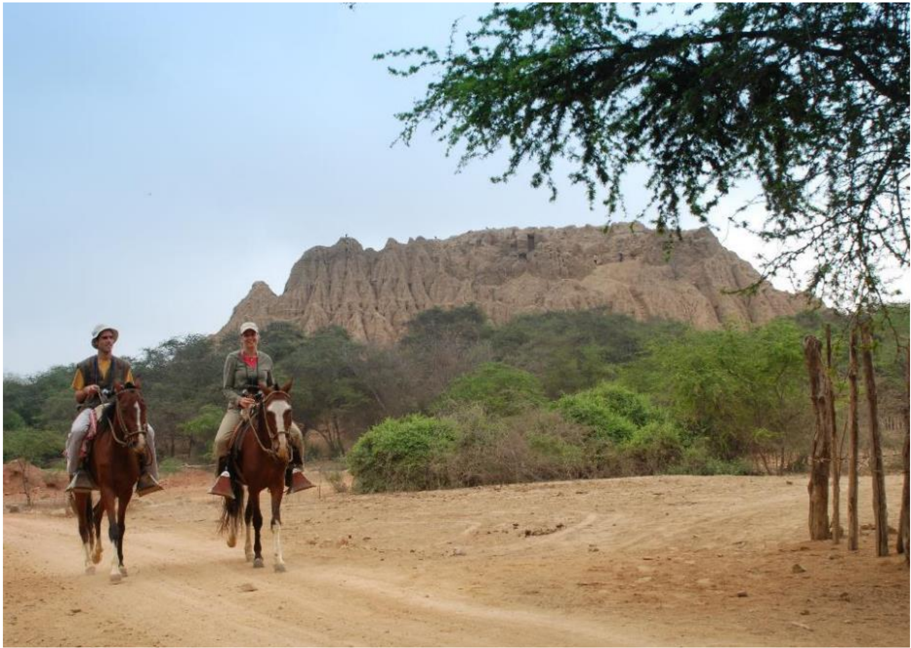
Bosque de Pomac