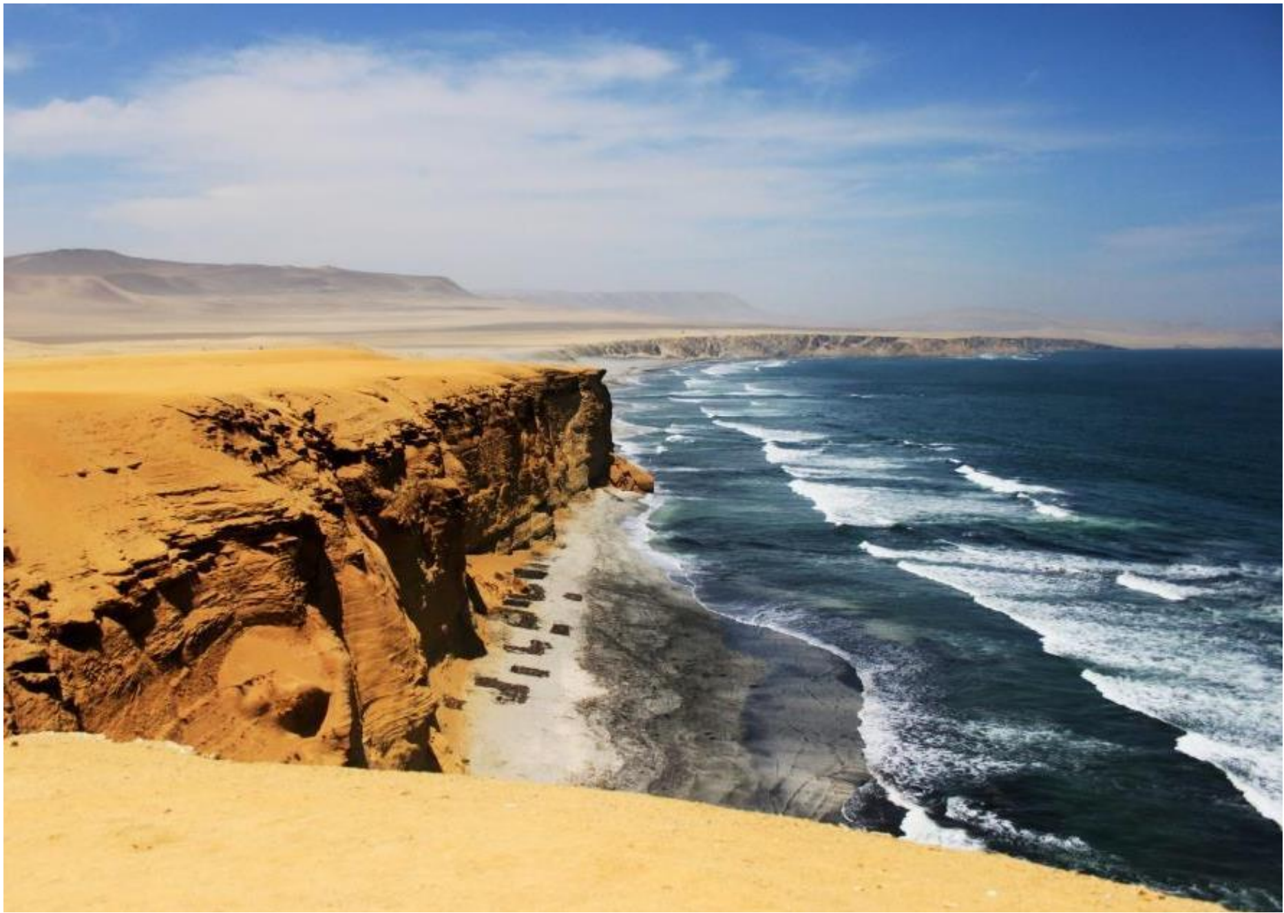
Reserva Nacional de Paracas