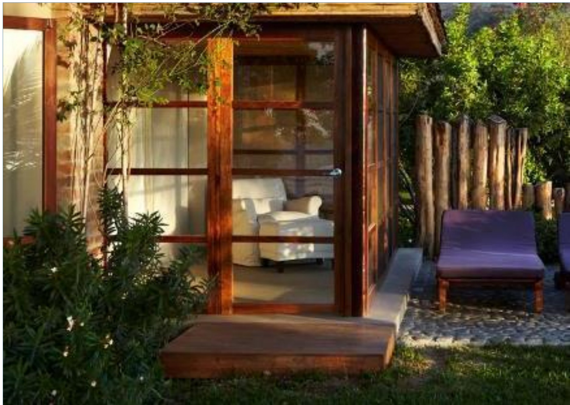
Hotel Boutique KiChic – Las Pocitas , Mancora