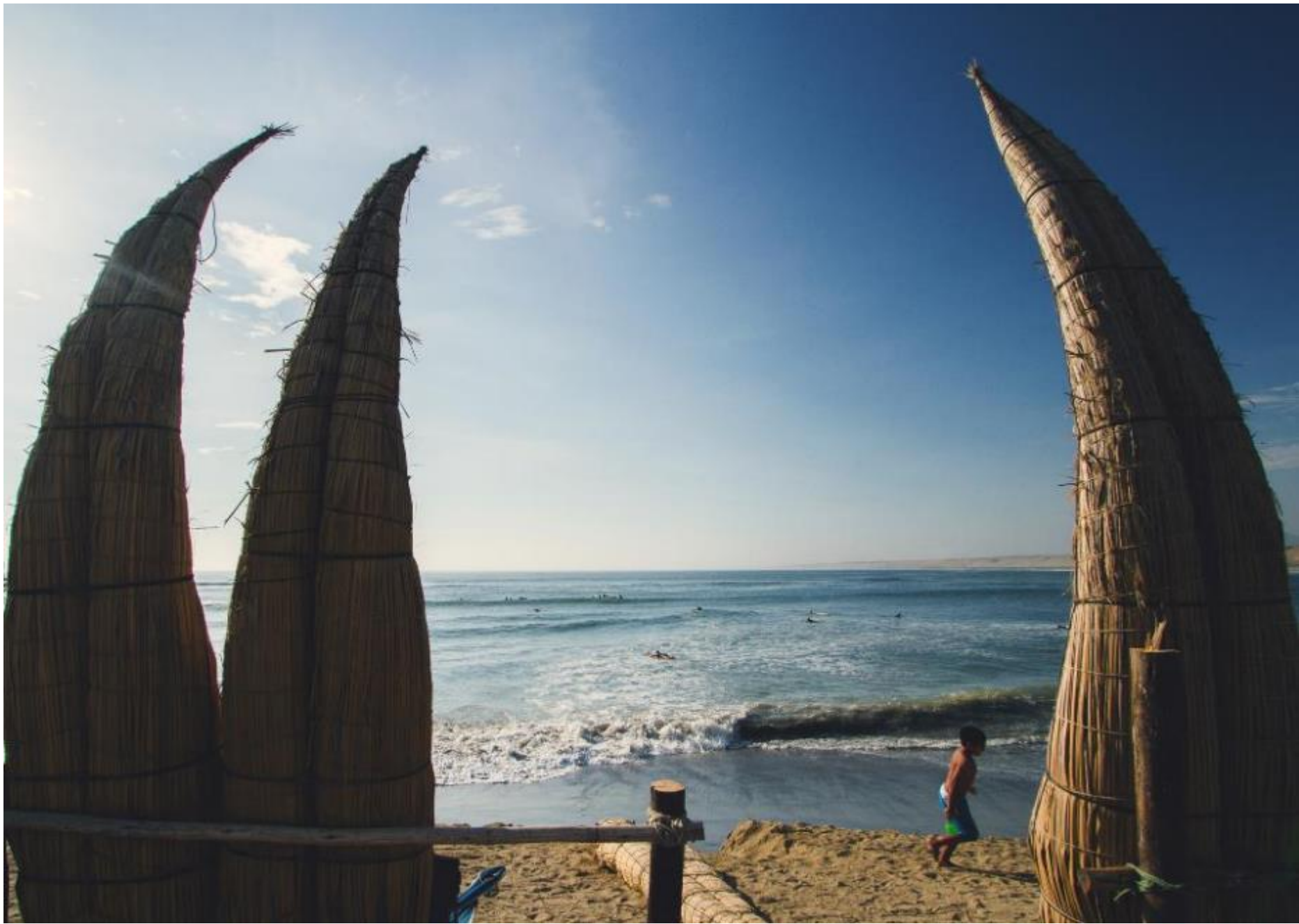
Playa de Huanchaco