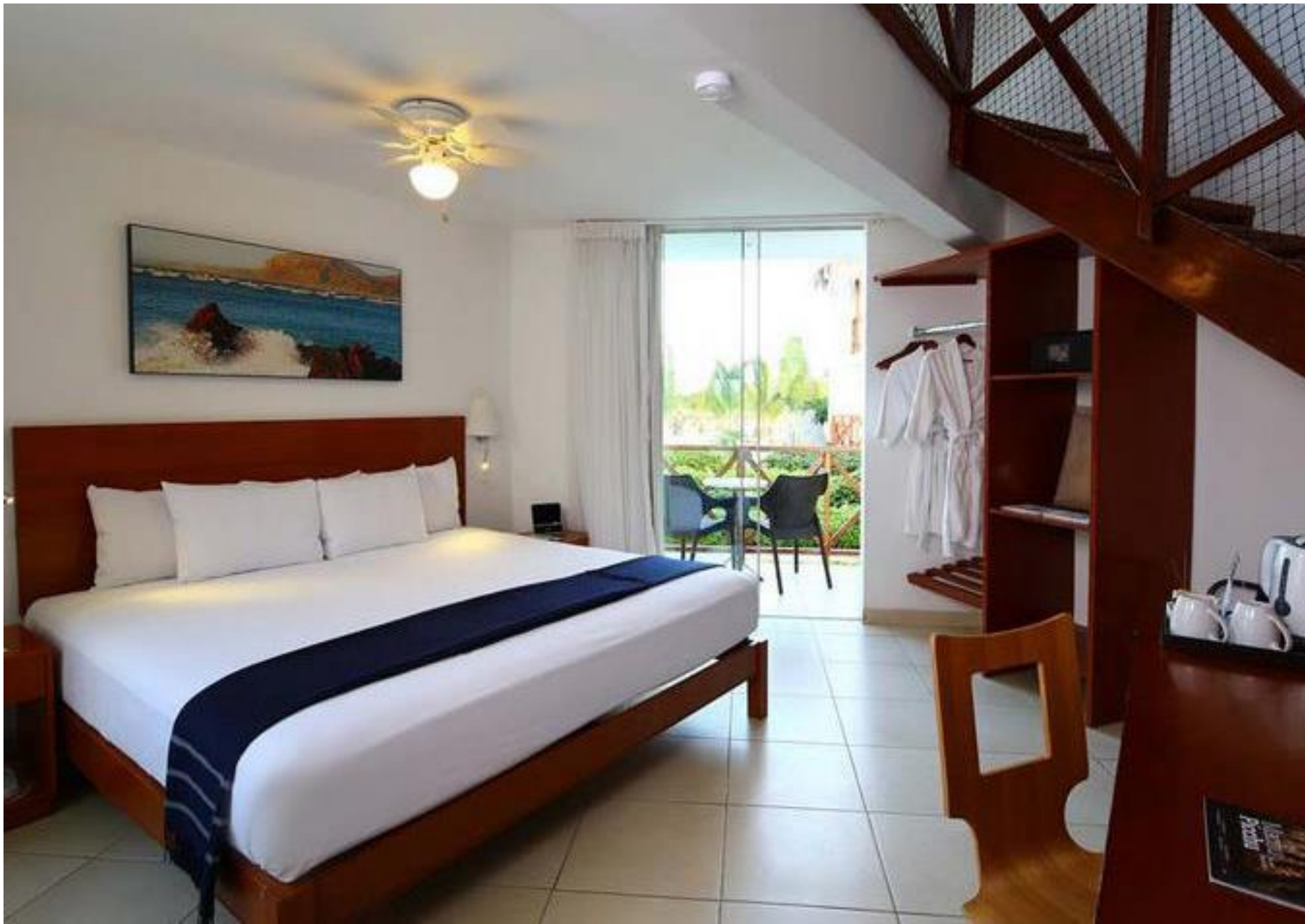
Casa Andina Select Zorritos - Tumbes