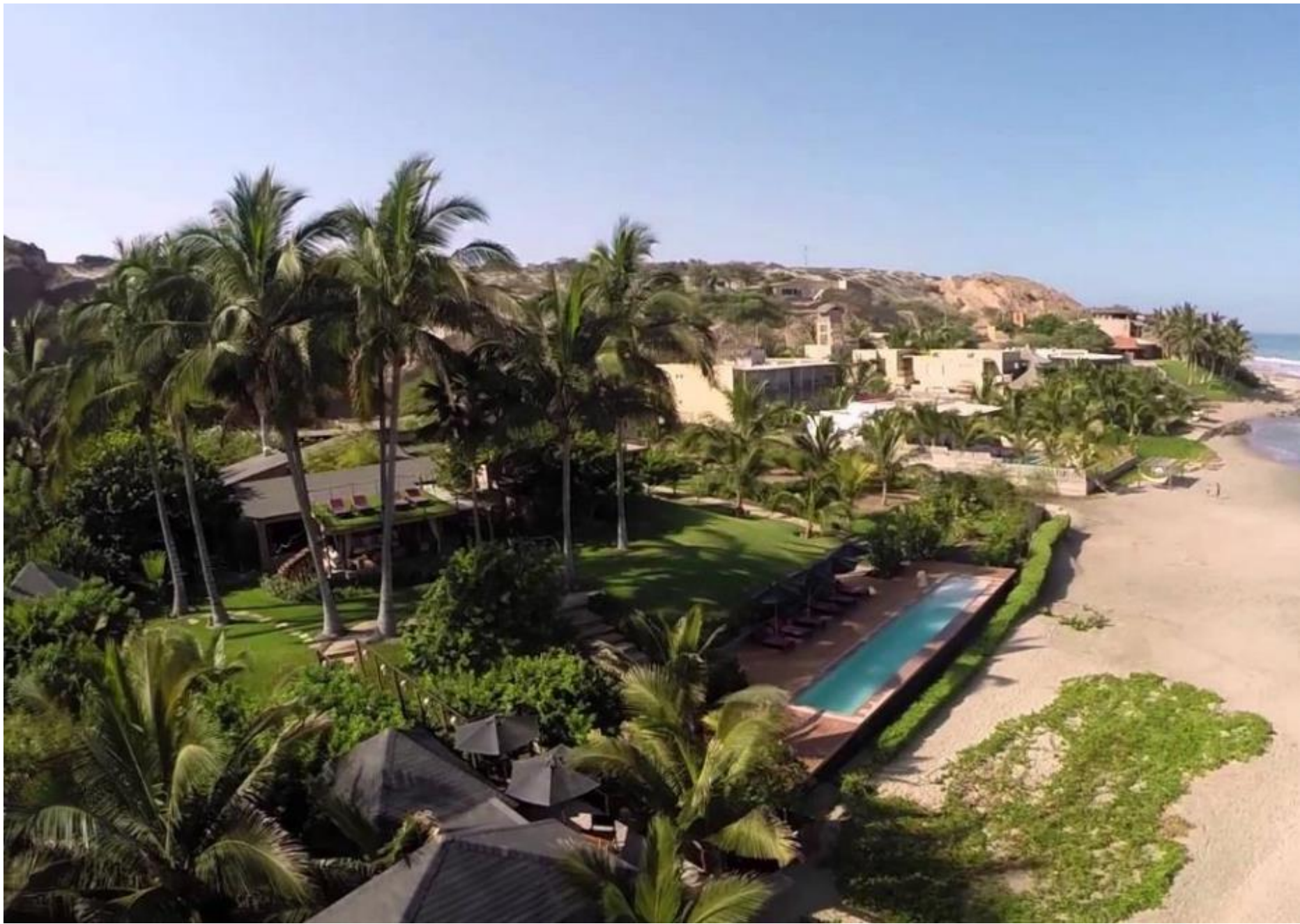
Hotel Boutique KiChic – Las Pocitas , Mancora