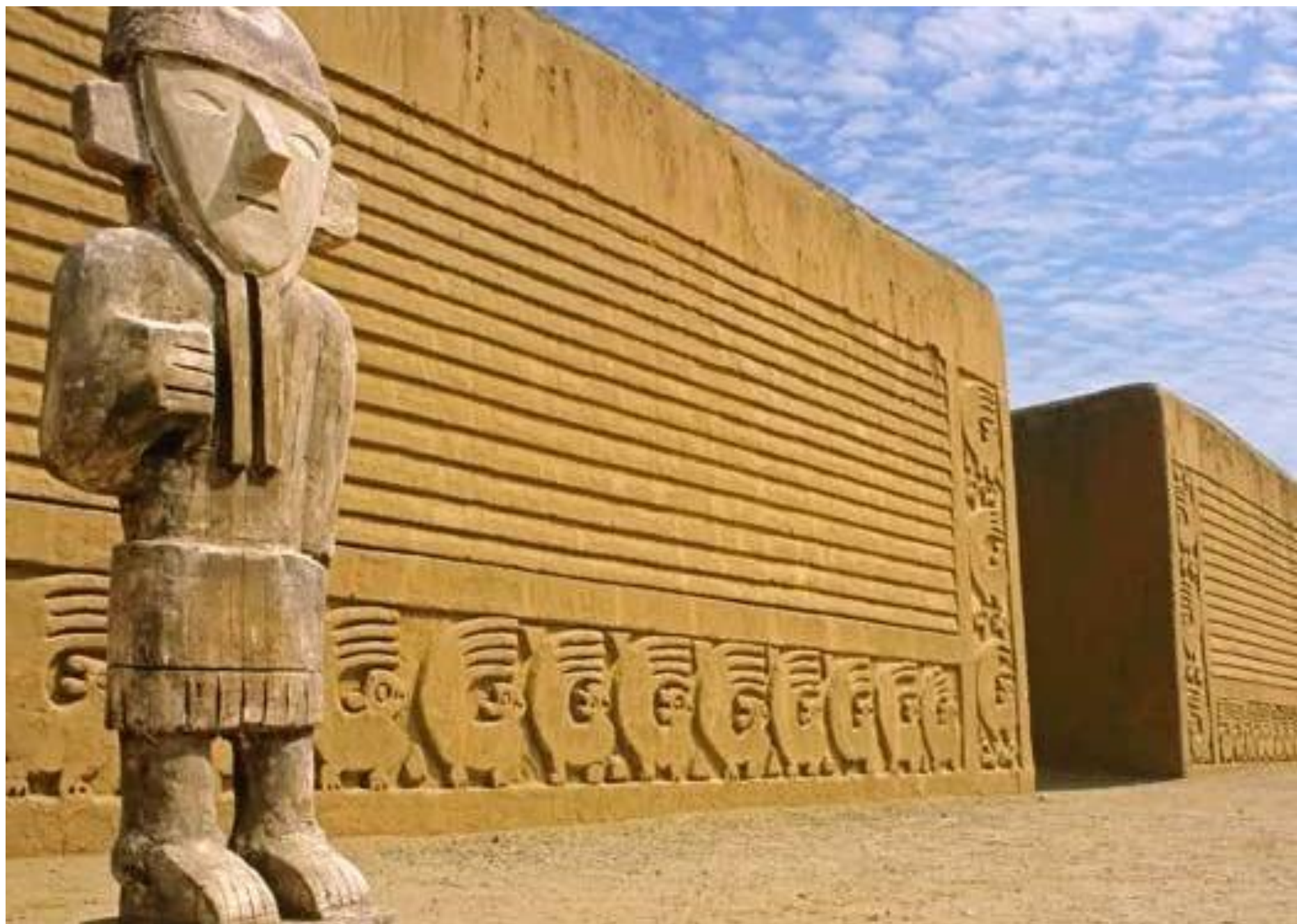
Ciudadela de Chan Chan