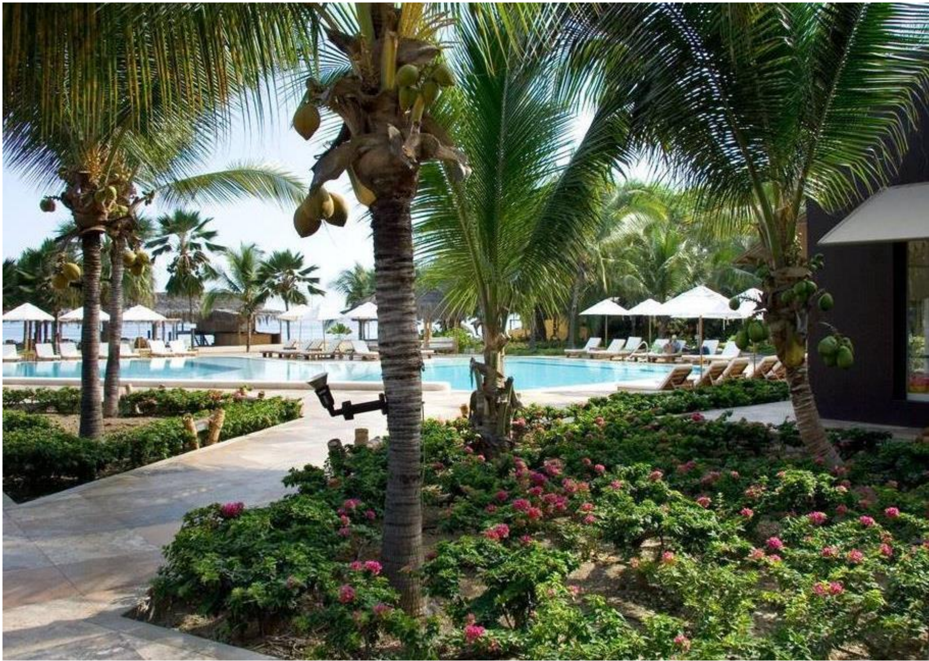
Punta Sal Suites y Bungalows